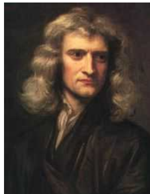
Sir Isaac Newton